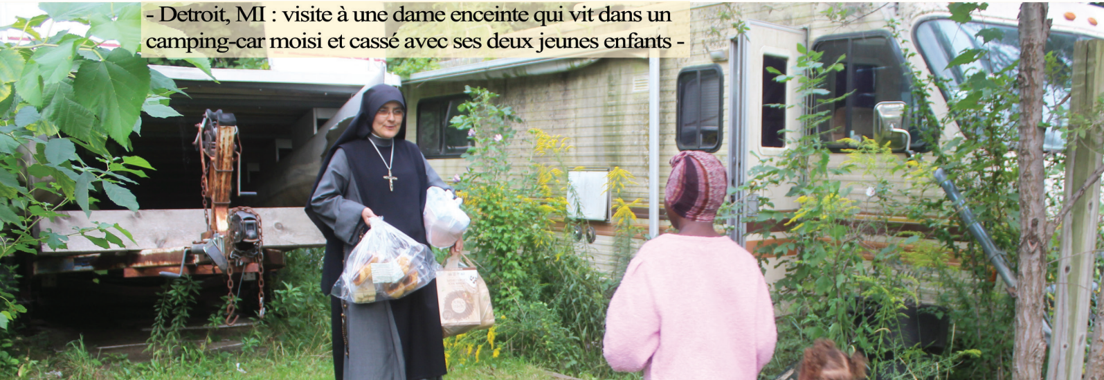
- Detroit, MI : visite à une dame enceinte qui vit dans un camping-car moisi et cassé avec ses deux jeunes enfants -

Fraternite Notre Dame 502 N. Central Avenue Chicago, Illinois 60644-1501 USA FraterniteNotreDame.org