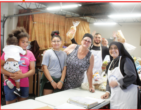
- Detroit, MI distribution alimentaire pour les familles en détresse -