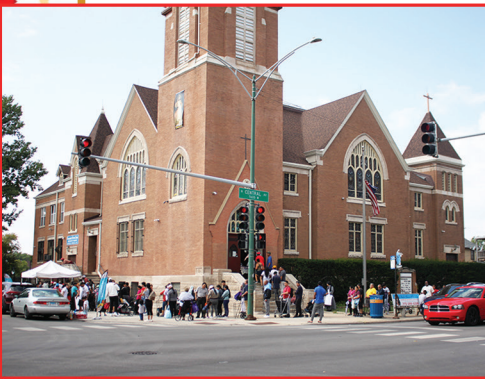
- Chicago, IL longue file des pauvres -