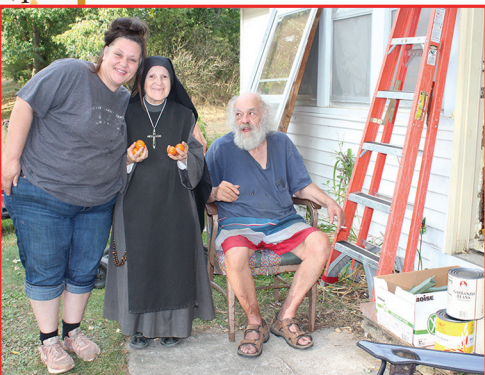
- Wisconsin, aide vestimentaire et alimentaire aux familles nécessiteuses -