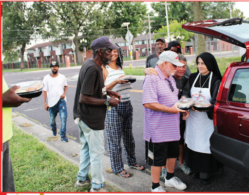
- A Peoria, IL aide aux sans-abris -